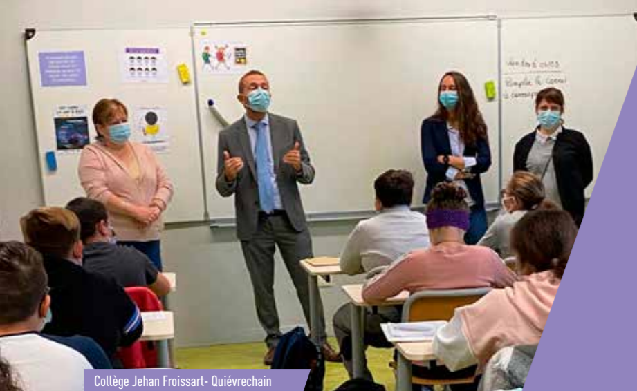
Collège Jehan Froissart- Quiévrechain