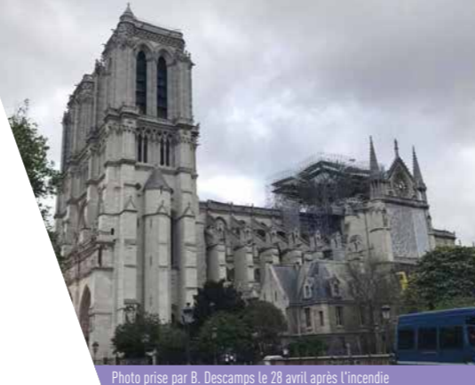
le 28 avril après l'incendie