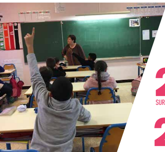
Avec les CM2 de l'école du Centre à Condé-sur-l'Escaut