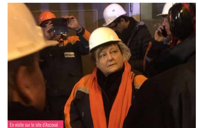
En visite sur le site d'Ascoval

La reprise du site Ascoval par le britannique British Steel, émanation de Tata Steel qui cherche à produire de l'acier en Europe, a été validée le 2 mai. Après le court répit de la reprise par Ascométal, après la déconfiture et les faux espoirs portés par Altifort, après l'annonce de procédures de redressement à l'encontre de British Steel, après surtout une mobilisation constante de plusieurs années, et l'implication de l'État, de la Région, de Valenciennes Métropole, les salariés, les syndicats, les élus locaux, les Saint-Saulviens et tout le Valenciennois ressentent un vif soulagement qui attend, cependant, que toute la lumière soit faite sur les procédures touchant British Steel. Le gouvernement répète qu'elles ne concerneraient pas Ascoval, qui pourrait reprendre son activité. C'est tout ce que je souhaite aux salariés, qui le méritent tellement, alors que nous attendons mardi 4 juin la venue à Ascoval de Marc Mehoyas, propriétaire du fonds d'investissement Greybull Capital qui détient British Steel.