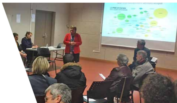
Table ronde sur la bioéthique, Valenciennes, 20 mai 2019